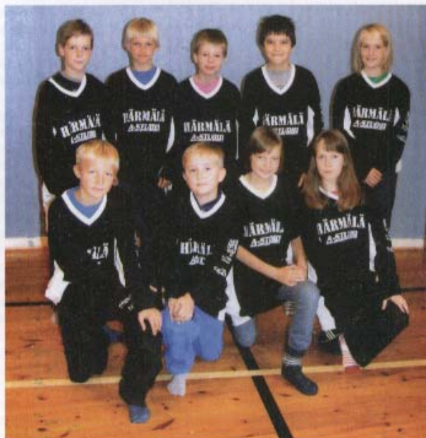
4-luokkalaisten sekajoukkue voitti pronssiottelussa Pispän tuloksella 2-1. He toteuttivat onnistuneesti taktiikkansa, joka koostui kahdesta osa-alueesta, tarkasta puolustamisesta ja maalien tekemisestä.