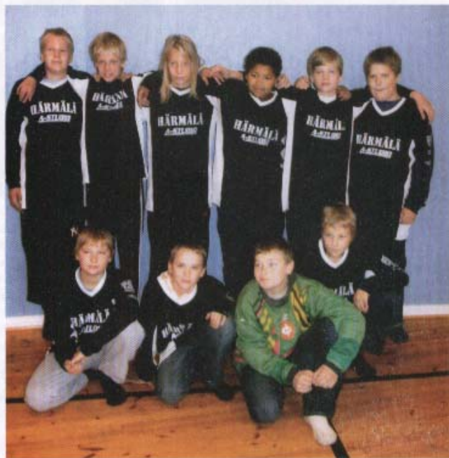
Pronssi edellyttää voittamista, 6-luokkalaiset pojat voittivat pronssiottelussa Raholan 2-1. Pelit onnistuivat "koska me oltiin niin parhaita".

Jutun kirjoitti Liisa Häikiö, pelaajat haastatteli Kielo Isomäki