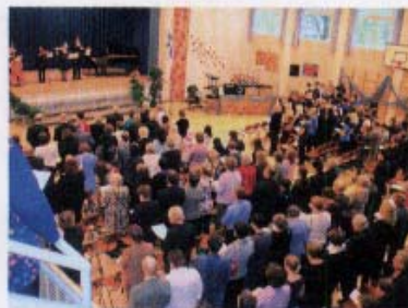
Hatanpään koulun juhlasali täyttyi entisistä ja nykyisistä opettajista ja oppilaista sekä muista juhlavieraista. Ohjelma oli arvokasta, unohtamatta ja oppilaiden pientä huumoria koulua ja opettajia kohtaan. Ohjelmasta välittyi osallistujille kuva, että koulussa opiskellaan hyvin monipuolisesti ja ilmapiiri on vapaa ja välitön.

Onnea ja menestystä vaativassa opetustyössä 50 - vuotta nuorelle Hatanpää koululle!