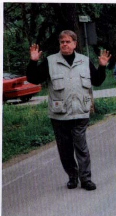
Kirjailija Uolevi Itkonen kertoo jutussa elävästi elämästä Nuolialantien varrella. Mennyt maailma välittyy monine mustoineen pikkupoikana Härmälässä asuneen Itkonen kautta nykyisille Härmäläläisille.

Rantaperkiön Työväenyhdistys ry. perustettiin vuonna 1906. Se oli talon pääkäyttäjät. Iltamien jälkeen oli yleensä 1,5 tuntia tanssia.