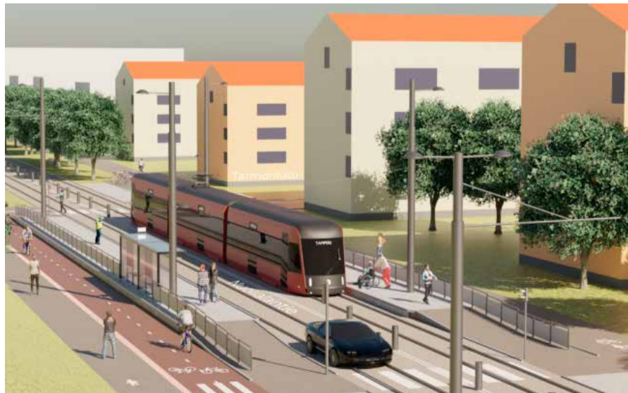
Havainnekuva Härmälänrannan kohdalta idän suuntaan.

Pirkkala–Linnainmaa -raitiotien hankesuunnitelma on valmis. Se sisältää muun muassa alustavat katusuunnitelmat sekä hankevaihtoehtojen vertailun ja vaikutusarvioinnin kustannusarvioineen. Hankesuunnitelma toimii pohjana kuntien päätöksille mahdollisesta jatkosuunnittelusta ja myöhemmin päätettävästä raitiotien rakentamisesta.