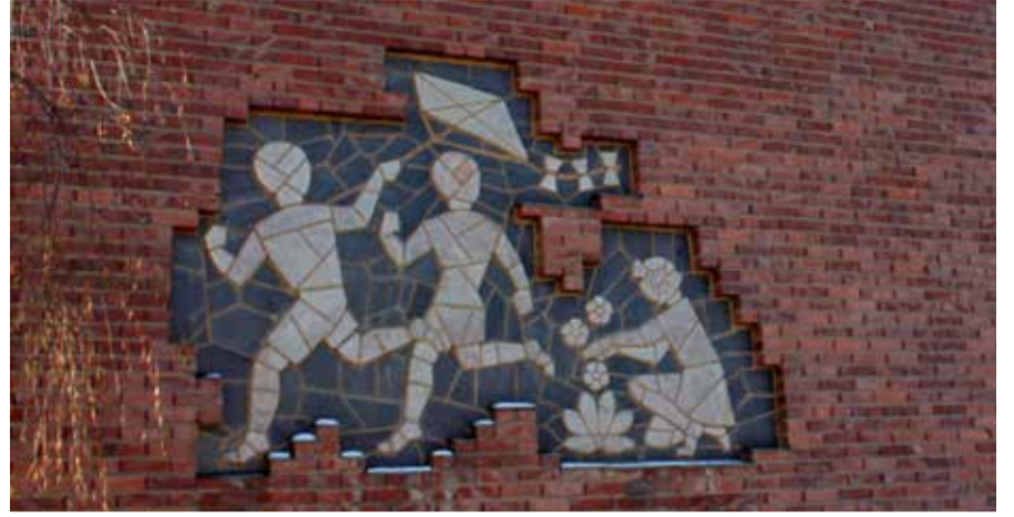
Härmälän koulun seinäreliefi, Kasvu. Tekijä Erkki Silvennoinen (1952).

Härmälän koulurakennuksessa on vuodesta 1953 alkaen toiminut myös Härmälän kirjasto. Kirjastossa tehtiin vuosina 2019–2020 ylläpitokorjauksia. Tuolloin tehtiin tiivistyskorjauksia joiden myötä myös pintoja jouduttiin uudistamaan sekä samassa yhteydessä tehtiin joitakin tilamuutoksia. Kirjasto avattiin käyttöönsä maaliskuussa 2020.