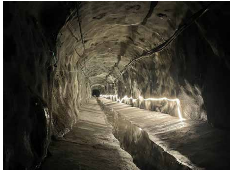
Valmis tuloviemäritunneli, jota pitkin jätevedet johdetaan Vihilahdesta Sulkavuoreen.