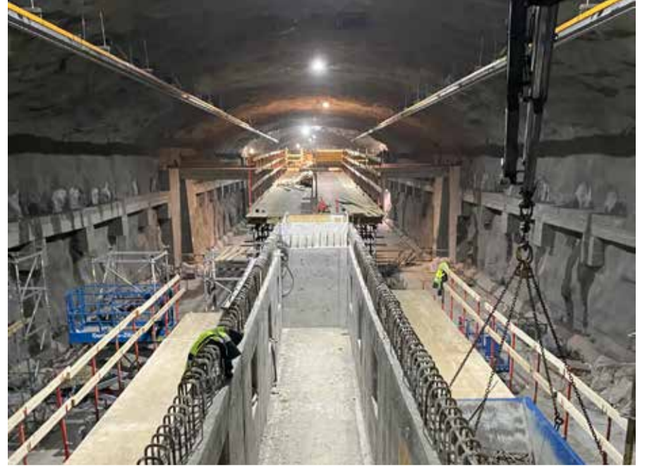
Rakennustyöt käynnissä puhdistamotiloissa.

Viinikanlahden jätevedenpumppaamo sijoittuu tulevalle uudelle Viinikanlahden asuinalueelle. Alueen asemakaavoitus on käynnissä ja valmisteluvaiheen aineisto on ollut vuoden vaihteessa julkisesti nähtävillä. ●