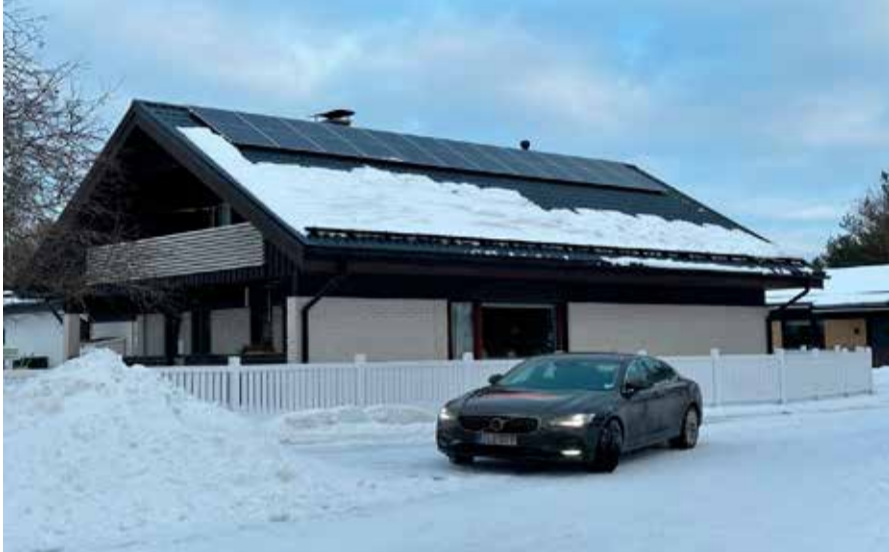
OmaWatti Oy:n kohde uusilla halfcut-aurinkopaneelilla Lentokentäkadulla.

OmaWatin Half cut/perc -aurinkopaneelit ovat jaettu kuuteen eri lohkokoon. Jos esimerkiksi kaksi solua ovat varjossa tuottaa paneeli vielä neljällä solulla.