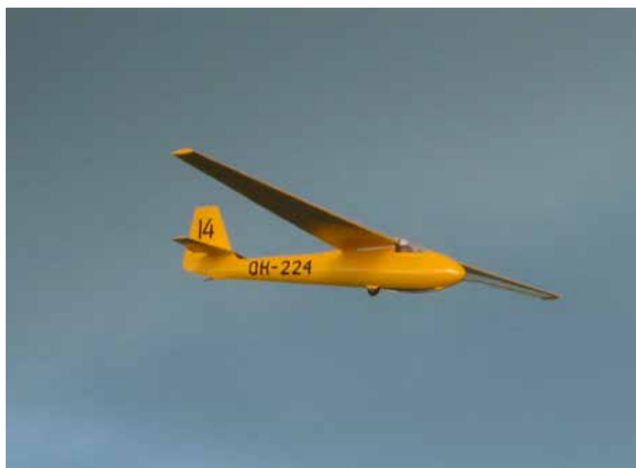
TIY:ssä kerhotoimintana rakennettu PIK-3c Kajava OH-224 on valmistunut vuonna 1960.

Yhdistys rakensi 1930-luvulla kaksi alkeisliitokoneita koulutustoimintaa varten ja yhden purjelentokoneen harrastuksessa pitemmälle edenneille. Koulutus on pyörinyt jo vuodesta 1935, selvästi ennen Härmälän kentän virallisia avajaisia keväällä 1937.