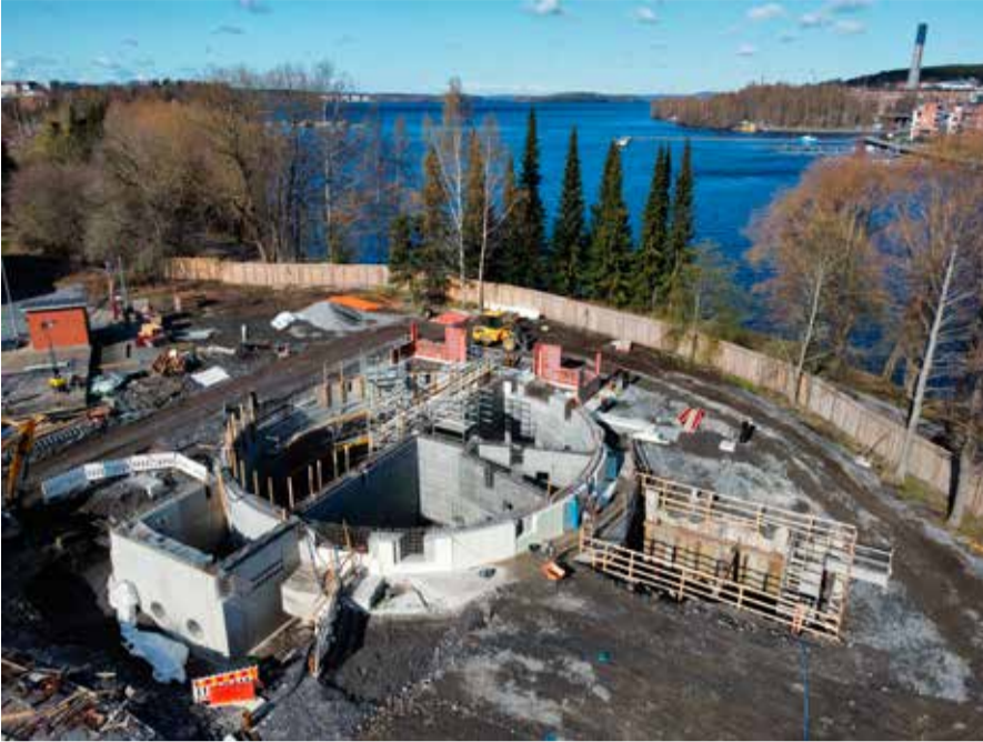
Allastilojen ja pumppusalin seinien valut ovat valmistuneet Viinikanlahdessa.

kennevalot, joissa on myös kevytliikenteen käyttäjille omat valot. Näitä valoja on erityisen tärkeää noudattaa.