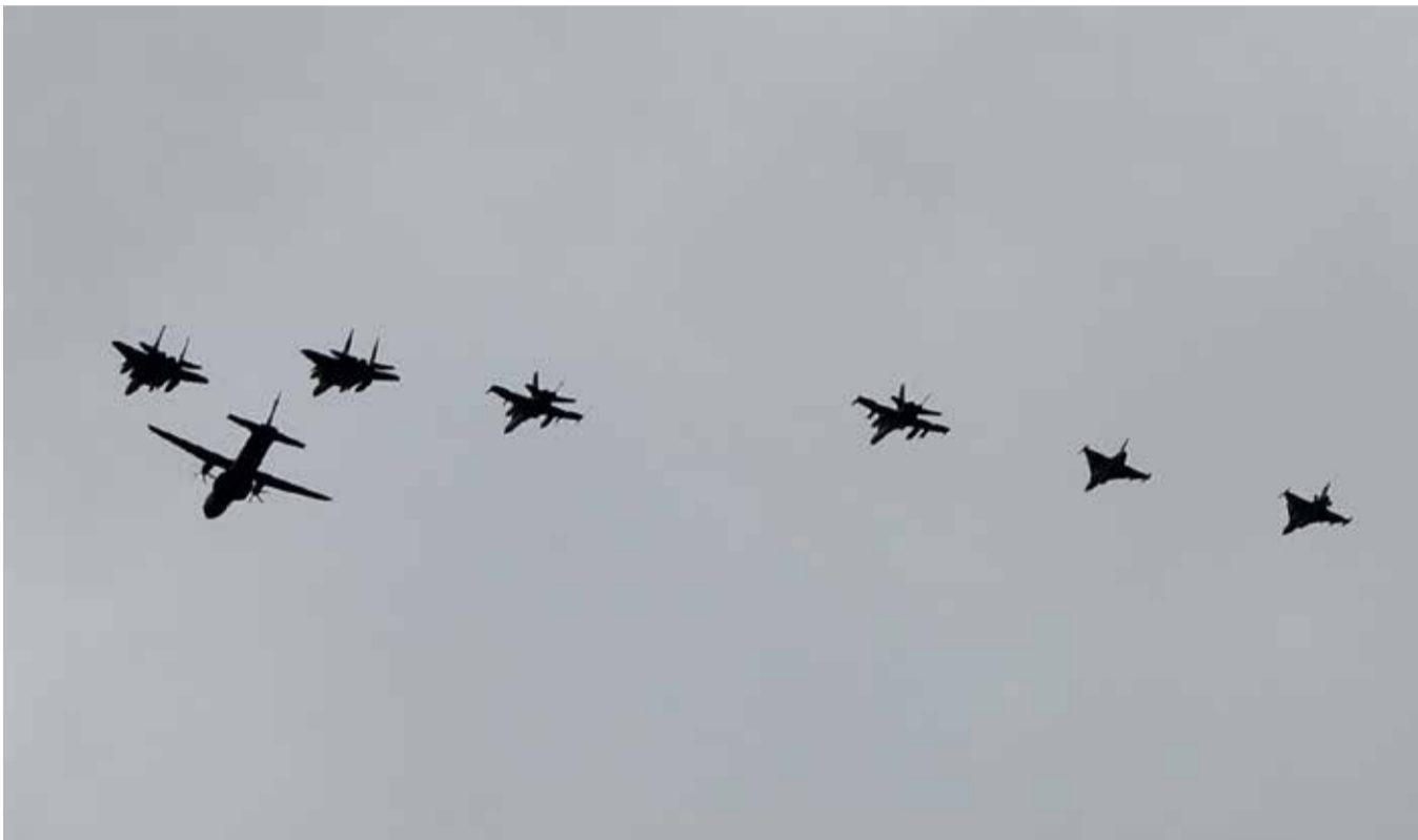
Suomen Ilmavoimat johtaa 29.5.–9.6. järjestettävän Arctic Challenge Exercise 23 -lentotoimintaharjoituksen. Koneet kuvattiin Härmälän yläpuolelta.

Harjoitukseen osallistuu varusmiehiä Rovaniemen ja Pirkkalan tukikohdassa toimien normaaleissa päivittäisissä tehtävissään. ACE 23:ssa käytetään harjoitussoihtuja ja -silppua, mikä voi näkyä valoilmioin taivaalla ja aiheuttaa lisäksi väärää säätutkahavaintoja. ●