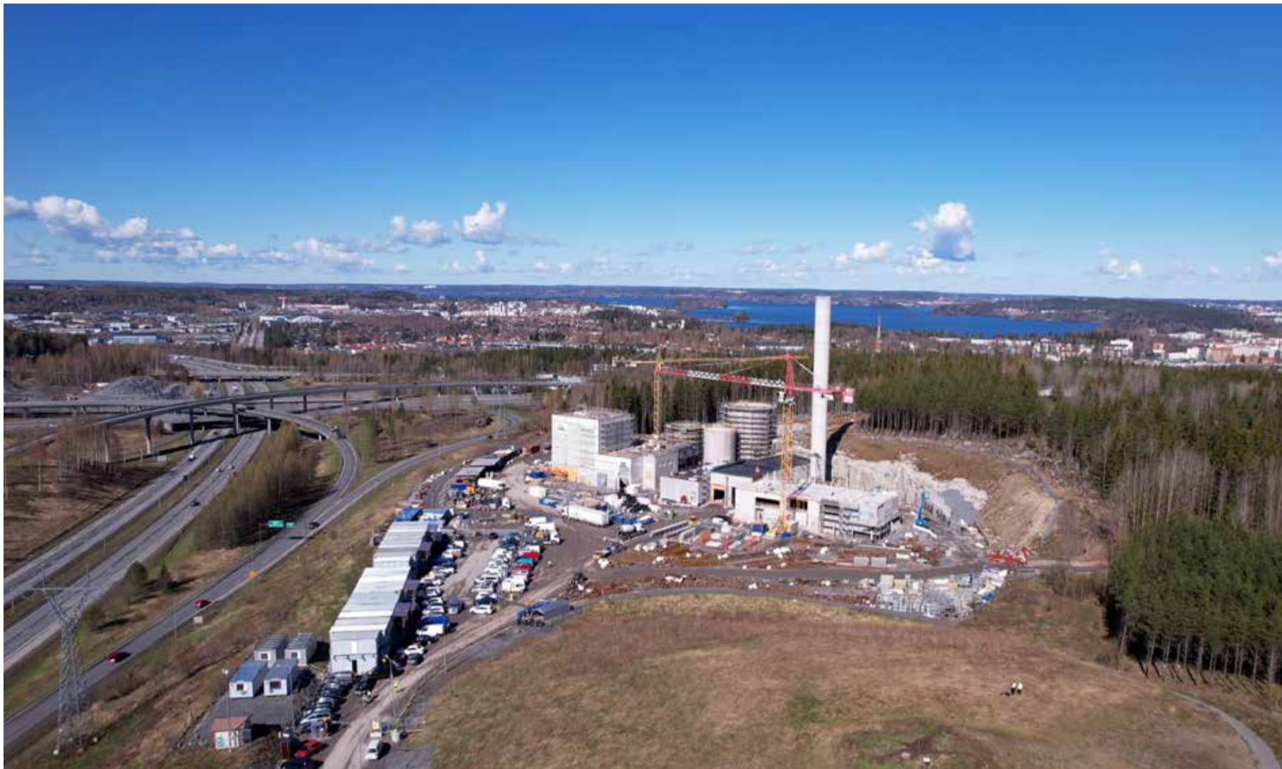
Sulkavuoren työmaa toukokuussa. Kaikki rakennusosat alkavat olla hahmollaan, kun hallintorakennuksenkin runko on pystyssä (äärimmäisenä oikealla).