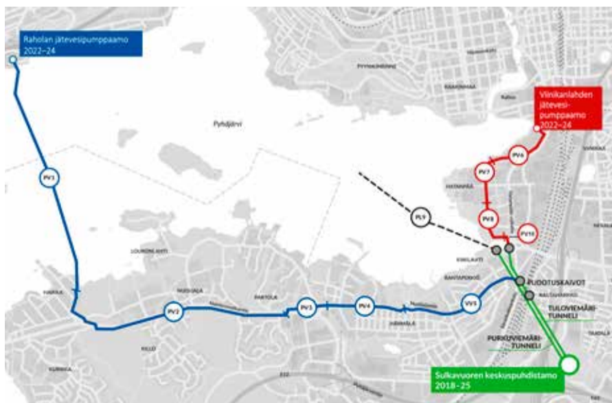
Paineviemäri PV10 valmistuu tämän vuoden aikana. Purkuputki PL9 puhdistetulle vedelle valmistuu ensi vuonna.

Sitä mukaa kun rakennusurakoitsija saa tiloja valmiiksi, niihin siirtyy eri tekniikkaurakoitsijat. Biokaasulaitoksen julkisivukasetointityöt ovat käynnissä. Luolasta maan päälle nousevilla exit-kuiluilla tehdään myös töitä, jotta pohjatasolta saadaan turvalliset hätäpoistumireitit myös rakennusvaiheen ajaksi.