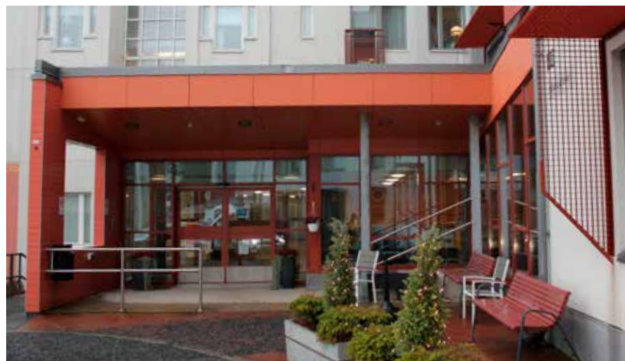
Härmälän kirjaston nouto- ja palautuspiste sijaitsee Kuuselakeskuksen aulassa vastapäätä pääsisäänkäyntiä.

Kullas valloitti kahden päivän yhteistulosten perusteella Tampere Dominator-tittelin jo seitsemännen kerran, kun järjestettynä on nyt yhdeksän Tampere Supercrossia. Zaragoza oli toinen ja Clason kolmas.