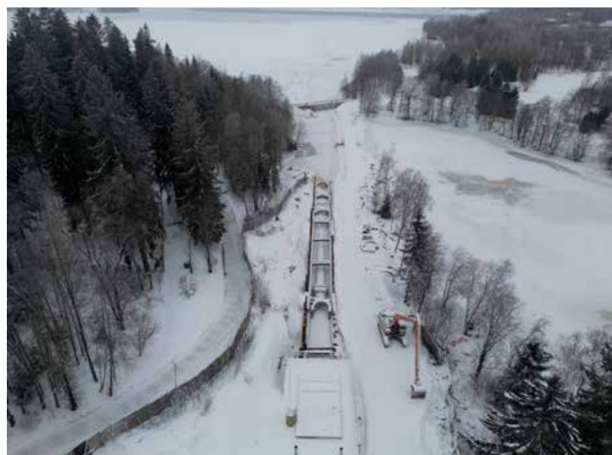
Purkuputken maaosuus Vihilahdessa.

Toivotan kaikille Nurkkakunnan lukijoille RAUHALLISTA JOULUA JA OIKEIN HYVÄÄ UUTTA VUOTTA 2024! ●