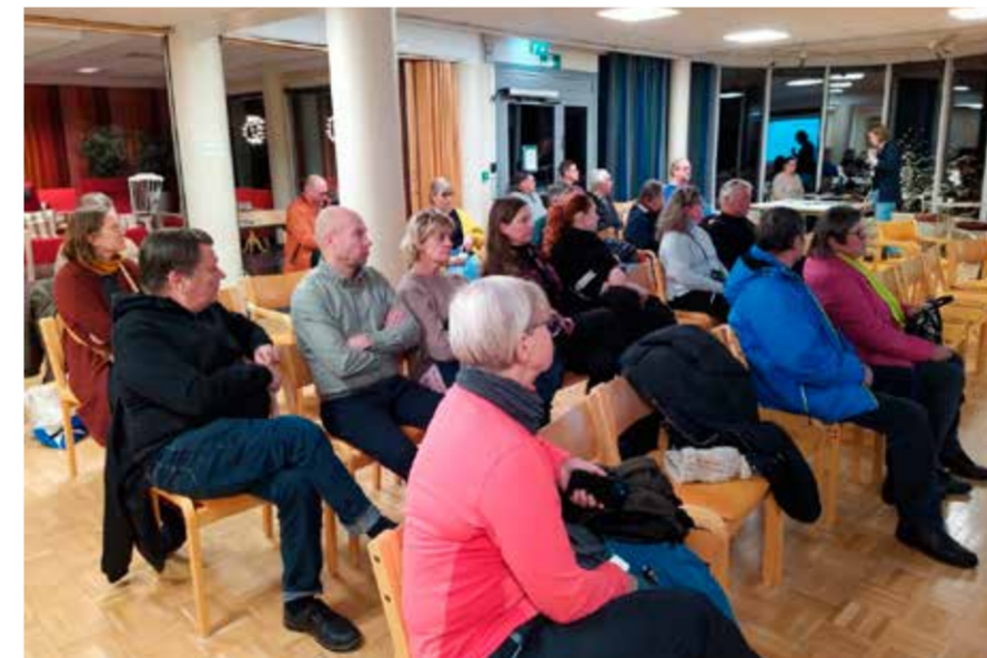
Yleisö kuunteli tiiviisti tilaisuuden alussa esitettyjä alustuksia kokeilusta ja sen toteuttamisesta.