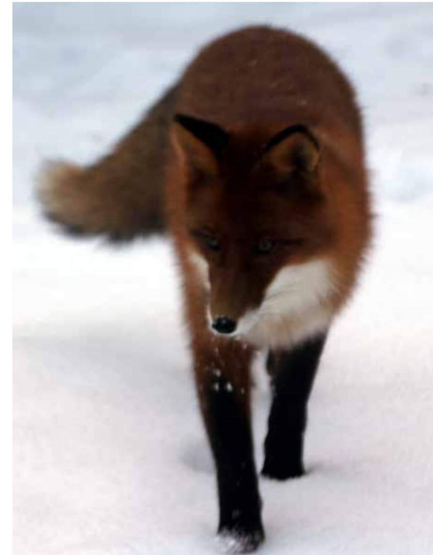
Kettu Repolainen asteli pihalla Härmälässä keskellä päivää.