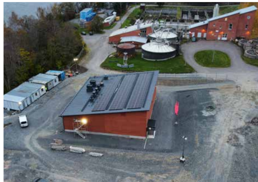
Raholan jätevedenpumppaamo nykyisen Raholan jätevedenpuhdistamon vieressä.

Toinen Vihilahdessa käynnissä oleva siirtoviemäriurakka sijoittuu Vihilahden pohjukkaan (Siirtoviemäri Vihilahti PV10). Putkilinjasta noin puolet alittaa Vihiojanlahden. Se on viimeinen osuus Viinikanlahden rakenteilla olevan pumpaamon suunnasta Keskuspuhdistamoon tuloviemäritunneliin johtavasta siirtoviemärikokonaisuudesta. Sen kautta Sulkavuoreen kulkee itäisen Tampereen ja Kangasalan jätevedet. Samassa urakassa Tampereen Vesi rakennuttaa alueelle omia vesijohto- ja viemäritöitä, jotka liittyvät jätevesien kääntöön aika-