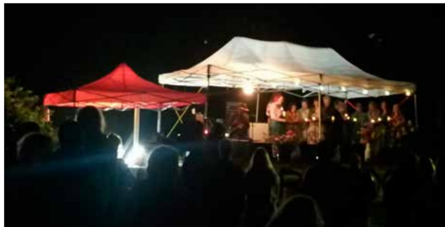
HärStock jatkui elokuisen hämärään asti ja hiljaisuus tuli kello 23.

Herkkusuille festareilla oli tarjolla murkinaa suolaisesta makeaan, sillä rantaan kääntyivät kotijäätelöä myyvä Kyytselän Jäätelö, pizzaa tarjoillut 456 Degrees sekä meksikolaista ruokaa valmistava La Negrita. Härmälän kulttuuriyhdistys tarjoi HärStock-paitojen