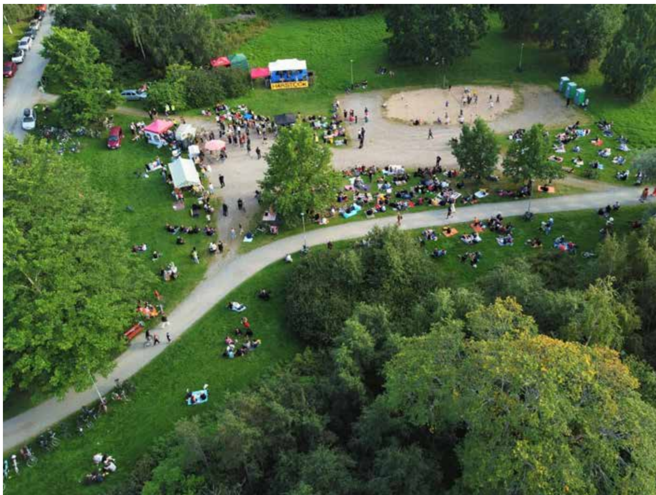
HärStock levittäytyi Härmälän rantapuistoon ja keräsi päivän aikana noin 1000 eri ikäistä musiikin kuuntelijaa.