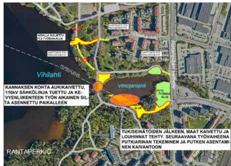
Kartta Vihilahden työmaa-alueista sekä liikennejärjestelyistä, jossa esitetty myös työn alla olevat alueet.

Hankkeen laajuus on pysynyt ennallaan, konseptia on sen sijaan hiottu. Merkittävin muutos oli, kun 2018 tehtiin päätös luopua lietteen polttolaitoksesta ja toteuttaa biokaasulaitoksen rakentaminen.